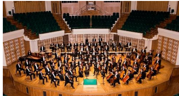
香港管弦樂團