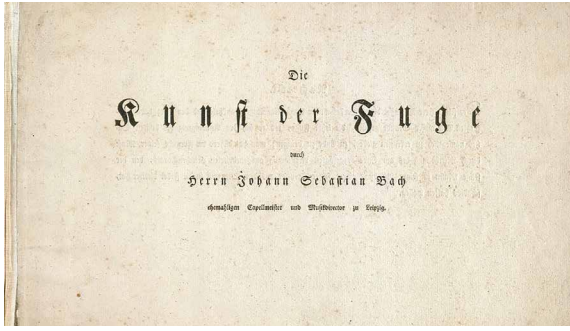
《賦格的藝術》初版標題頁

令人振奮的作品。事實上，與其說賦格是死板的曲式，倒不如說是個想像過程，一種擁有無限適應力的創作技巧。在《賦格的藝術》裡，巴赫以20多首想像馳聘、作法超卓的賦格曲，示範了賦格曲的潛力。他年輕時已努力令自己在作曲方面樣樣精通；1705年更徒步走了250里路（因為他負擔不起其他交通工具），到呂貝克聆聽偉大的對位法大師布斯泰烏德彈奏管風琴——另一個原因，正如巴赫後來憶述，「去了解我所學這門藝術的種種」。